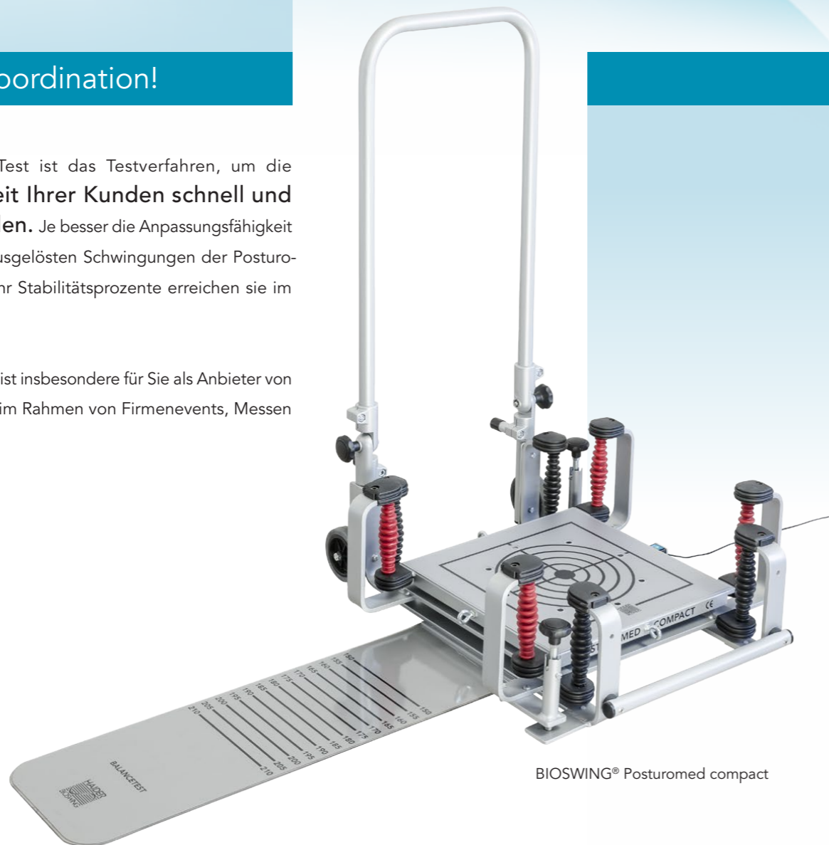
BIOSWING® Posturomed compact

Der BIOSWING® Balance-Test ist insbesondere für Sie als Anbieter von Gesundheitsveranstaltungen im Rahmen von Firmenevents, Messen oder Aktionstagen geeignet.